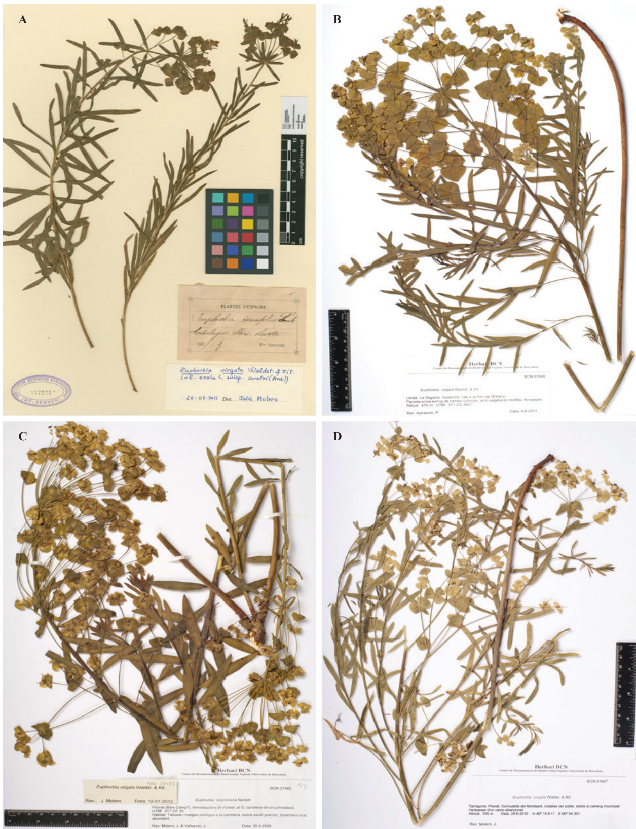
Figura 2. Plecs d'herbari (BC i BCN) representatius de les diferents formes de variació d' Euphorbia virgata al territori: (A), Llers; (B), Guissona; (C), Cornudella; (D), Falset.